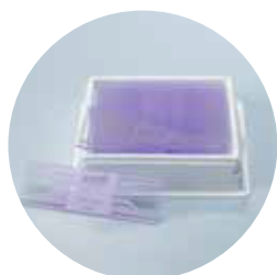
Стандартные покровные стекла