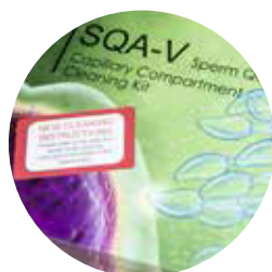
Набор для очистки