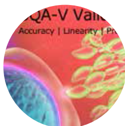
Набор для валидации